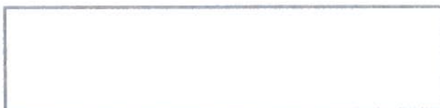
Figura 1 - Título da figura

XXX XXXX XXXXXXXX XXXXXXX XXXXXXXX XXXXXXXX XXXXXXXXXXXX XXXXXXXXXXXXXXXX XXXXXXXXXXXXXXXXXXX XXXXXXXX.