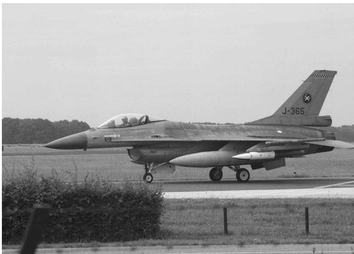
Fig. 4 - F-16AM / DCA holandês com bomba B61 de exercício na estação de armamento 3

França e do Reino Unido, das forças aéreas americanas na Europa detentoras de munições nucleares e de outras munições nucleares americanas que serão disponibilizadas, em tempo de guerra, a unidades aéreas com certificação nuclear de alguns países NATO.