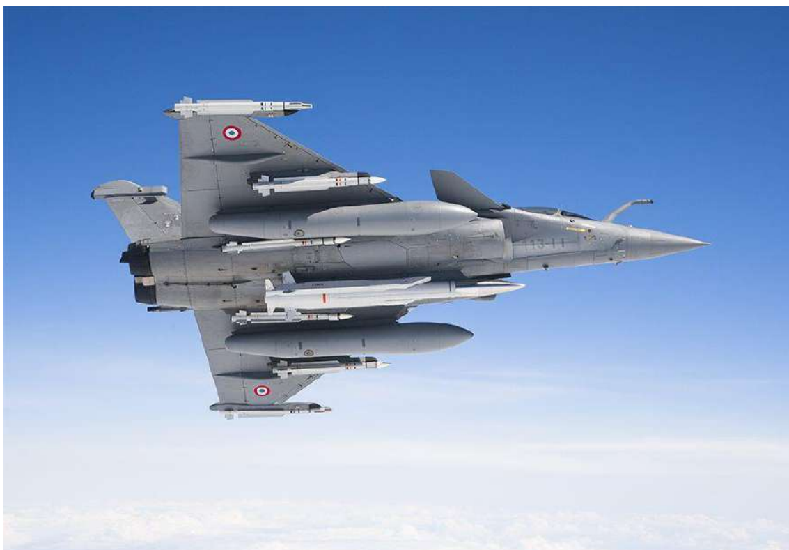
Fig. 2 - Avião Rafale com míssil ASMP-A na estação de armamento central