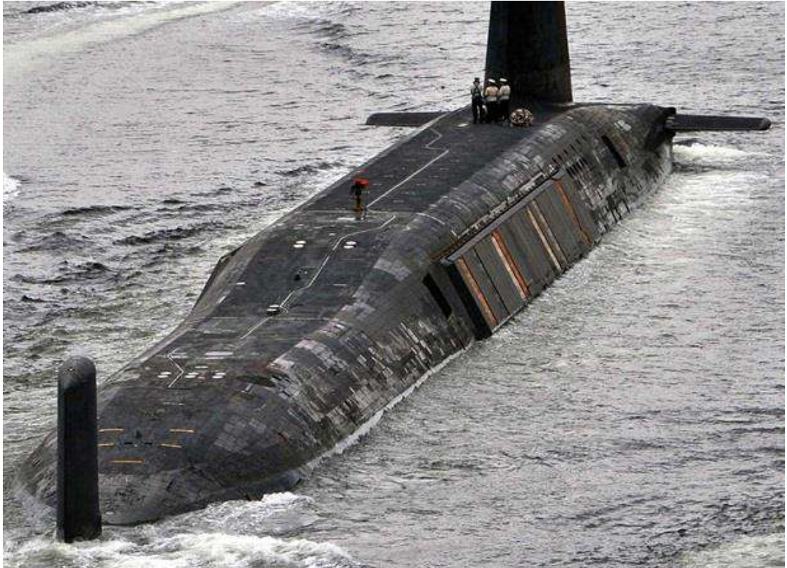
Fig. 3 - Submarino britânico da classe Vanguard