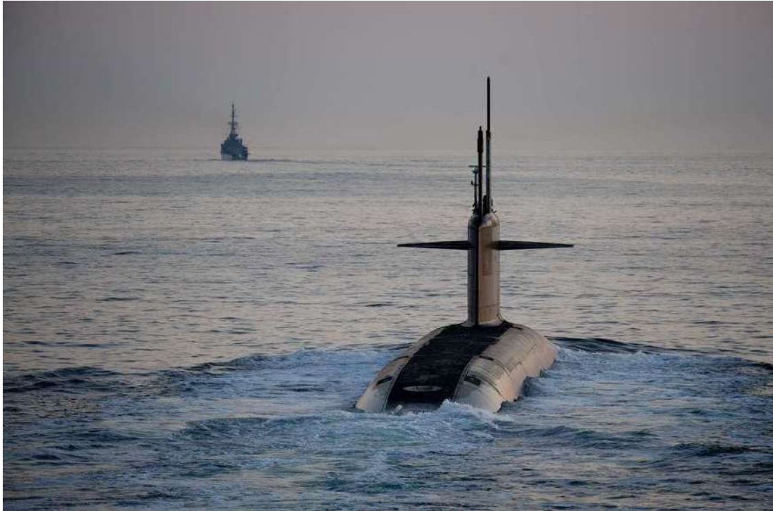
Fig. 1 - Submarino nuclear da classe Le Triomphant